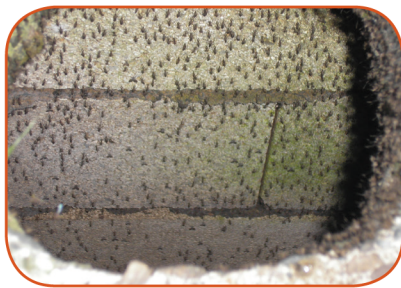
Mosquitoes in a septic tank