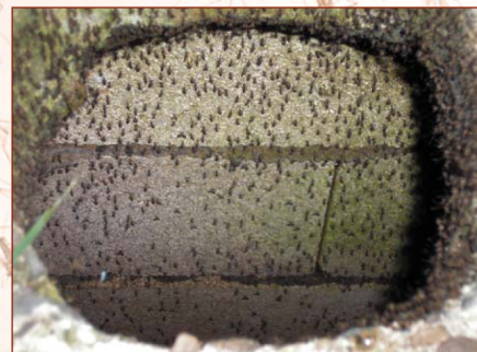
Mosquitos en el pozo