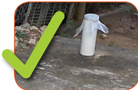
Septic tank ventilation pipe with screen mesh