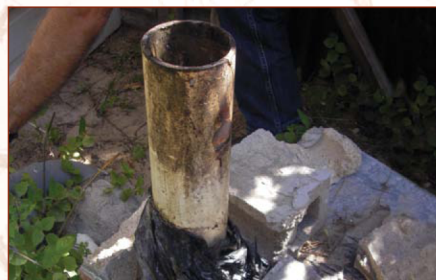
Respiradero sin tela metálica