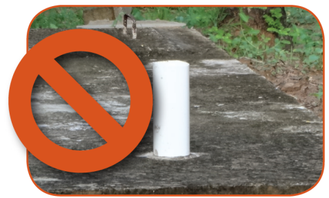
Cover ventilation pipes