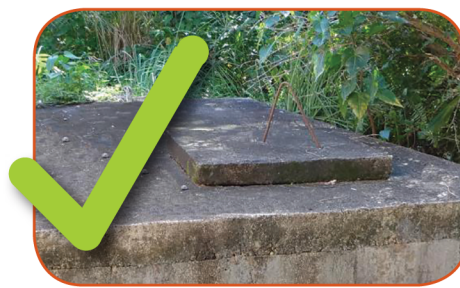
Septic tank with concrete cover