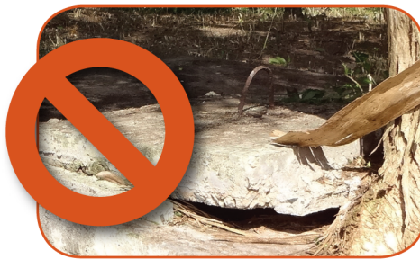
Repair broken septic tank covers