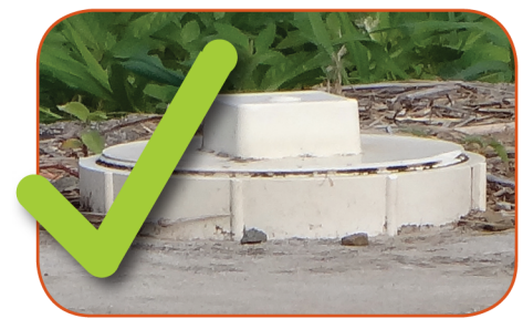
Septic tank sealed with PVC cap