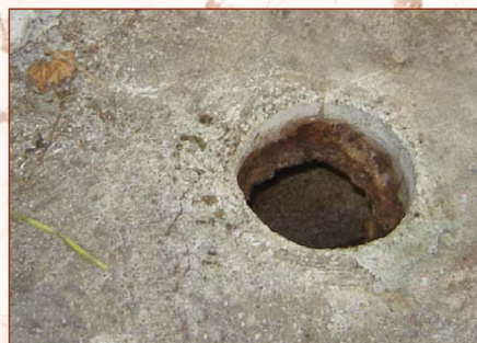
Pozo séptico abierto